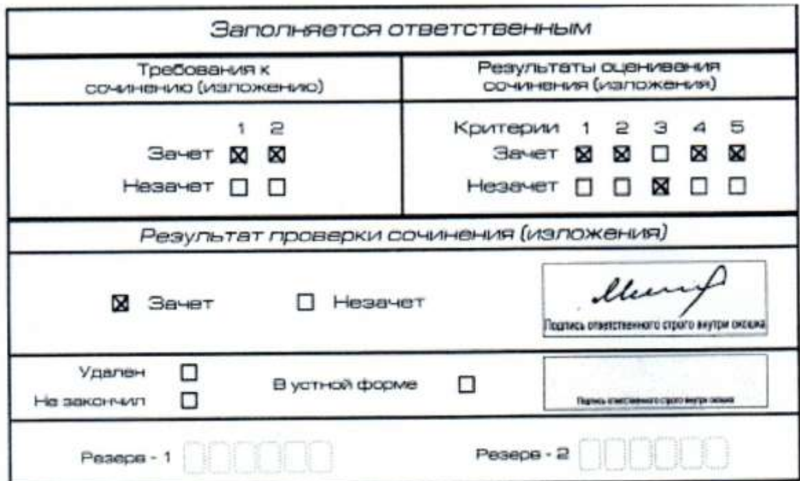
Рис. 11. Область для оценки работы