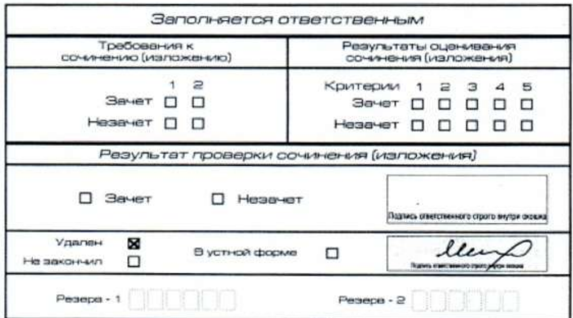
Рис. 7 Заполнение полей нижней части бланка регистрации (удаление с экзамена)

В бланке регистрации указанного участника итогового сочинения (изложения) необходимо внести отметку «X» в поле «Удален» . Внесение отметки в поле «Удален» подтверждается подписью члена комиссии (рис.7).