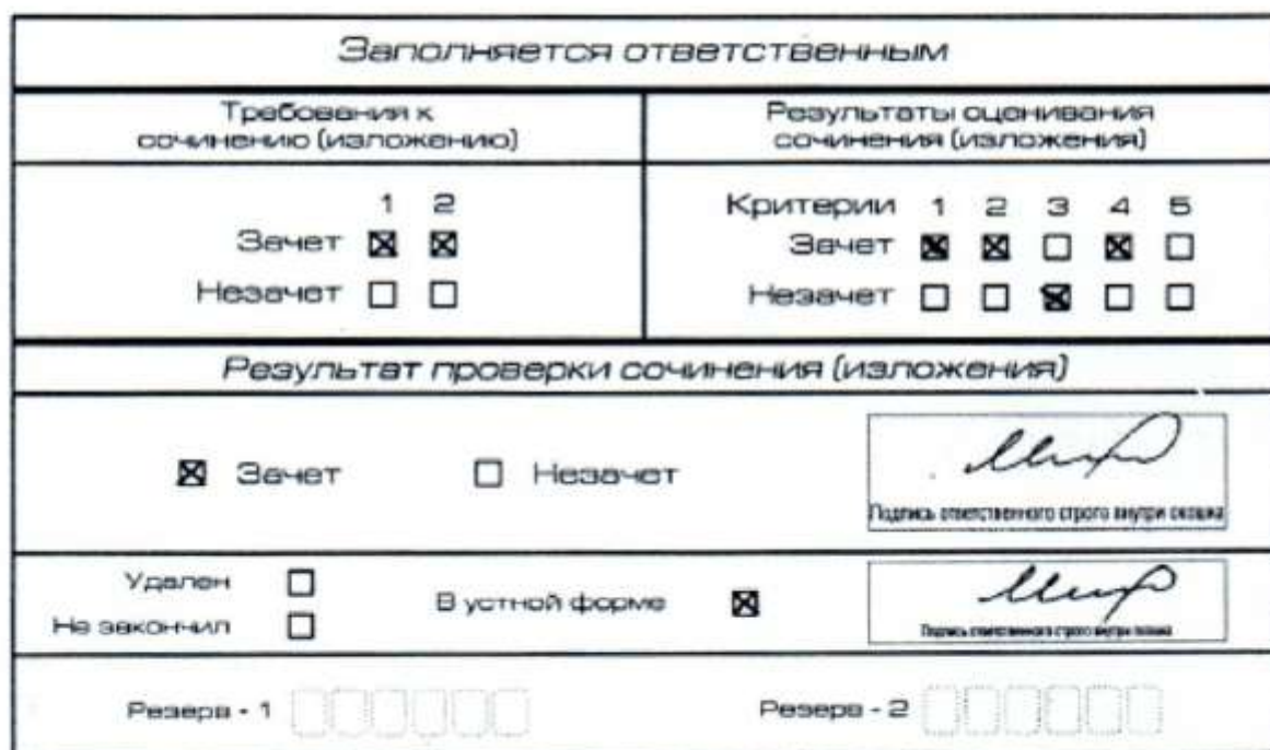
Рис. 12. Область для оценки работы сочинения (изложения) в устной форме

После окончания заполнения бланка регистрации ответственное лицо ставит свою подпись в специально отведенном для этого поле.